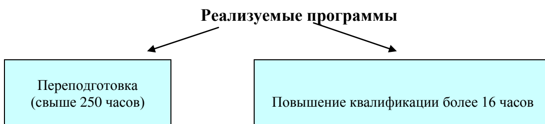
Рисунок 2 – Программы факультета дополнительного образования

Обучение на факультете проводится на платной основе, в соответствии с заключаемыми договорами и реализуются в следующем виде: